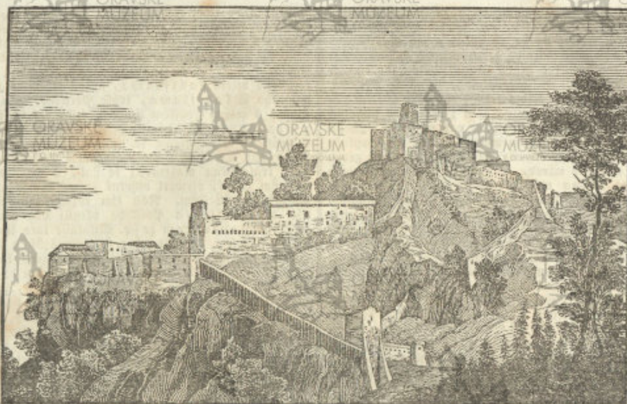
(Trenčinský hrad v Uhrtách.)